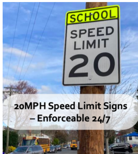
20MPH Speed Limit Signs - Enforceable 24/7